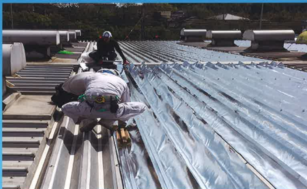
折半屋根に遮熱シート施工

サーモバリア遮熱シートを施工した場合、 室内雰囲気温度が最大11℃下がりました。 冷房費節約・作業環境の改善・雨漏り防止効果